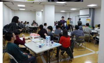
交流サロンの様子