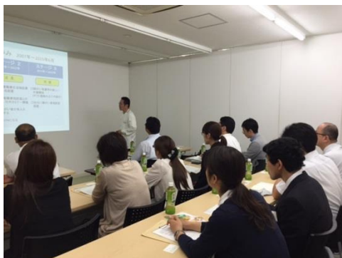
障害者雇用企業見学会セミナーの様子 [平成27年9月10日]

障害のある当事者や就労支援担当者を対象とした「スキルアップ研修」をはじめとして、他事業との連携を図りながら、働く力や支える力の向上を支援するとともに、企業向けの取組(企業人事担当者向けの企業見学会など)も実施します。