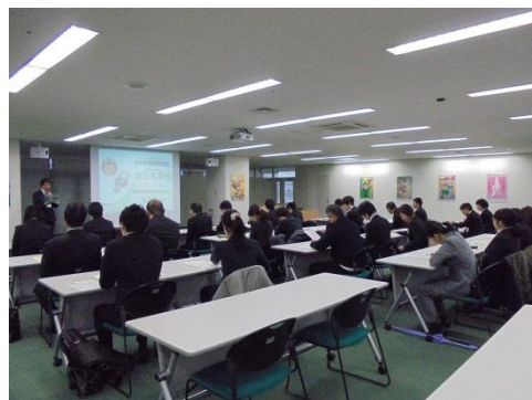
スキルアップ研修(支援者向け)の様子 [平成27年12月10日]