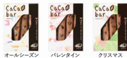
< カカオバー >