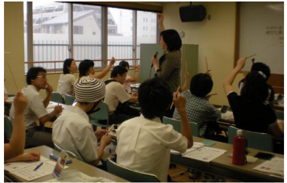
スキルアップ研修の様子 〔平成23年8月5日 ～働く準備をしよう！～〕

スキルアップ研修をはじめとして、他事業（障害者職場実習・チャレンジ雇用推進事業、はあと・フレンズ・プロジェクト推進事業など）と連携を図りながら企業向けの取組（企業訪問による職場実習機会の開拓、企業人事担当者向けの職場見学など）も実施します。